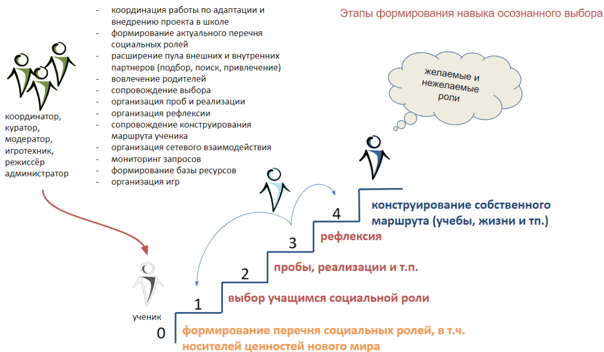
Рисунок 2. Этапы формирования навыка осознанного выбора

Предполагаем возможным три варианта трансформации существующей модели школы: минимум (на уровне класса, нескольких классов без объединения их ресурсов), медиум (объединение ресурсов параллели классов или отдельного структурного подразделения) и максимум (трансформация всей образовательной организации). Варианты трансформации представлены на схеме: